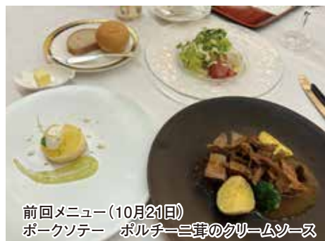
前回メニュー(10月21日) ポークソテー ポルチーニ茸のクリームソース

白魚のエスカベッシュ サラダ仕立てに 森林鶏と木ノ子の軽い煮込み 豆乳クリームソース ハーブティーのブランマンジェと梨 パン コーヒー