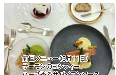
前回メニュー(5月11日) サーモンのヨシファイ ハーブ香るサバイヨシサーズ