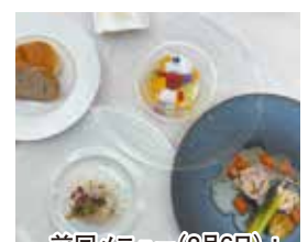
前回メニュー(2月6日)：甘鯛の海藻蒸し

サーモンと茸のプレゼ ヴェルモットとほうれん草のソース 根菜のサラダ 柑橘風味のドレッシング 豆腐のガトーフロマージュ パン コーヒー