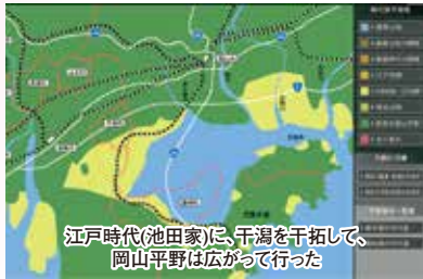
江戸時代(池田家)に、干潟を干拓して、 岡山平野は広がって行った