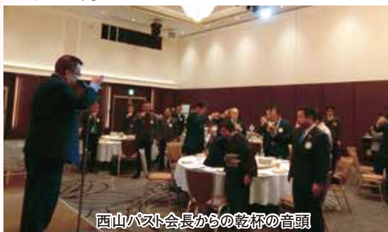
西山バスト会長からの乾杯の音頭