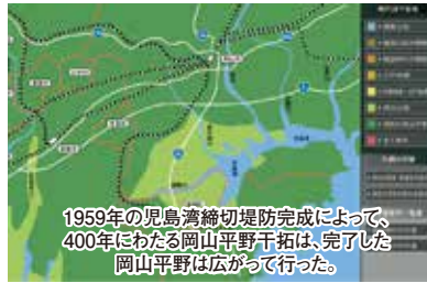
1959年の児島湾縮切堤防完成によって、 400年にわたる岡山平野干拓は、完了した 岡山平野は広がって行った。