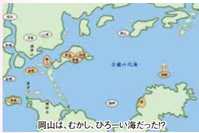
岡山は、むかし、ひろーい海だった!?