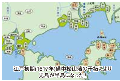
江戸初期(1617年)備中松山藩の干拓により 児島が半島になった!!