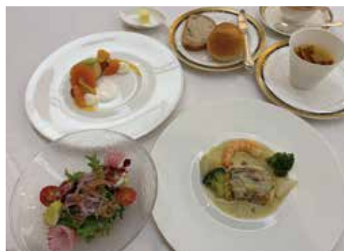
前回メニュー（11月25日）

ローストビーフサラダ 玉葱のドレッシング 魚介とほうれん草のクリームショートパスタ チーズのブランマンジェと柑橘 パン コーヒー