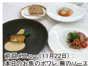
前回メニュー(11月22日)： 本日のお魚のボワレ 蕪のソース