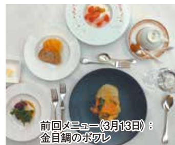
前回メニュー(3月13日): 金目鯛のポワレ

森林どりと野菜のスパイスカレー カリフラワーのマリネとリーフのサラダ 文旦とアールグレイのジュレ コーヒー