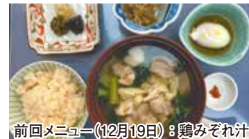
前回メニュー(12月19日)：鶏みぞれ汁