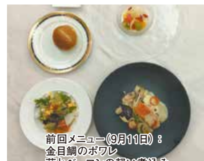
前回メニュー(9月11日): 金目鯛のポワレ 茸とベーコンの軽い煮込み

甘鯛のポワレ 柚子香る燕のソース 南瓜とさつまいものサラダ 豆乳シフォンケーキ パン コーヒー