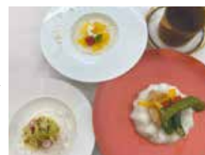
前回メニュー(8月8日)： 森林どりと野菜のスパイスカレー

井物 豚キムチ 井物 豚キムチ 刻み葱 糸唐辛子 針海苔 酢橘おろし ※別千代口※ 温玉 振り柚子 小鉢 鯛南蛮漬け 薄玉葱 針人参 振り柚子 冷物 小角冬瓜 玉蜀黍すり流し 蓴菜 青海苔 香物 二種 甘味 桃羊羹 ホイップ ミント コーヒー