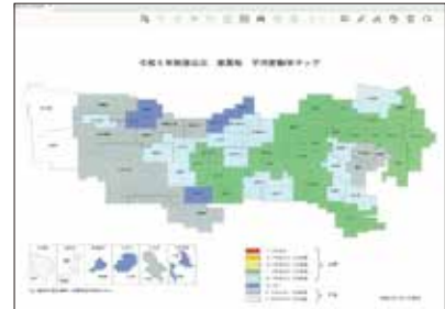
東京都心三区の商業地の地価下落と新しいビジネススタイル