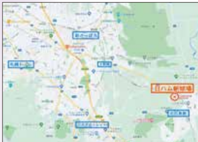
日本ハムホーム球場移転と地価公示