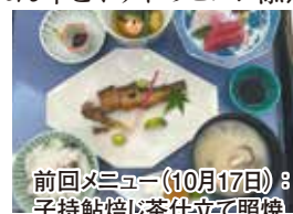
前回メニュー(10月17日) 子持鮎焙じ茶仕立て照焼

井物 豚生姜焼き丼 豚スライス 刻み葱 サニーレタス 小鉢 きのご揚げ出汁 榎木茸 エリンギ 湿地 大根おろし 糸花鰹 美味出汁 青梗菜の炊いたん 薄揚げ 胡麻油 赤出汁 3種 香物 3種 コーヒー