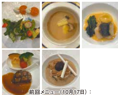
前回メニュー(10月17日): 夜間例会特別メニュー